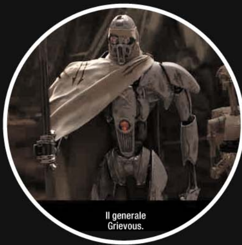
Il generale Grievous.

Luke scopre che Darth Vader è suo padre.