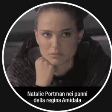
Natalie Portman nei panni della regina Amidala

Anche qui Samuel L. Jackson interpreta la parte dello Jedi Mace Windu, che possiede la spada laser viola. L'attore sapeva che sarebbe dovuto morire in questo film e ha accettato la parte solo a patto che Lucas girasse al suo personaggio una morte gloriosa: di recente l'attore ha confermato in un talk show Usa che avrà un'uscita di scena piena di significato, non «come un disgraziato qualsiasi».