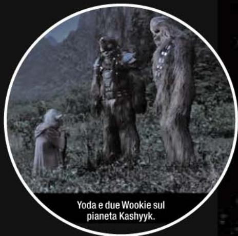
Yoda e due Wookiee sul pianeta Kashyyk.