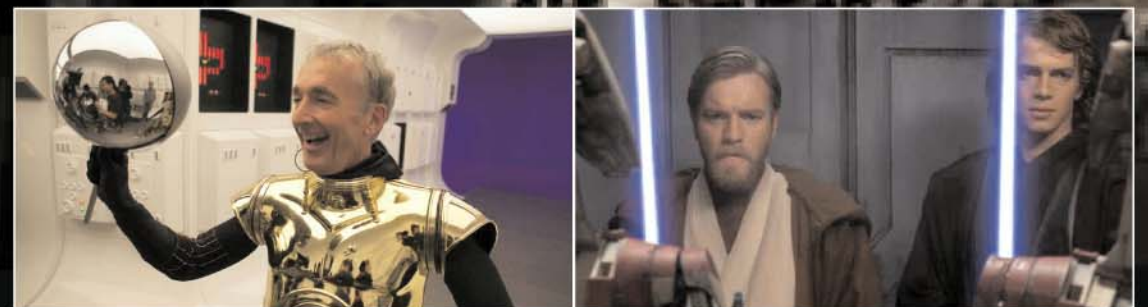
L'attore Anthony Daniels indossa la tuta del droide C3PO.

Nel doppiaggio del '77 i droidi R2D2 e C3PO furono ribattezzati C1P8 e D3B0, Darth Vader divenne Lord Fener e la principessa Leia prese il nome di Leila. La "guerra dei cloni", poi, rievocata dal vecchio Obi-Wan, venne tradotta in "guerra dei quoti", senza che nessuno spiegasse chi fossero questi ultimi. Con la nuova trilogia, la Lucasfilm ha voluto uniformare i nomi in tutte le lingue e anche il titolo della saga non è più Guerre Stellari , ma ovunque Star Wars .